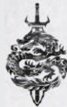
A háborús öltözet a harci szándékot jelzi.

Észrevehetitek, hogy Pál ebben a szakaszban nem határozza meg a szellemi harc pontos módszereit. Inkább azt hangsúlyozza, hogy fel kell készülnünk és készen kell állnunk. Pál még azt sem mondja meg, hogy mit kell tennünk a karddal; csak azt mondja, hogy legyen kardunk. Pál konkrét stratégiákat sem ad a harchoz. Valójában egyáltalán nem sokat beszél a harcról. Alapvető utasítása az, hogy öltözzünk fel és maradjunk felöltözve Isten fegyverzetébe, majd álljunk fel és harcoljunk.